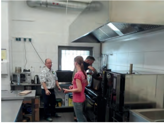
18.5: Start des neuen Projekts: Strassenfeger Street Tour