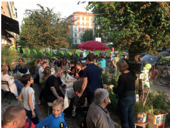
24.5.: Tag der Nachbarn und Fotoaktion „Wer wohnt in der Oderberger?“