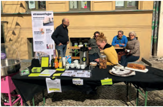
Sonntage in der Oderberger 12