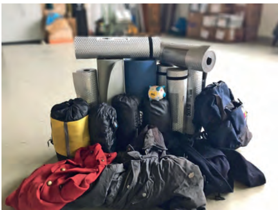
10.12.18: Kooperation Food Circus: Sammlung. Mitarbeiter sammeln Schlafsäcke, Jacken, Handschuhe, Isomatten, Wollstrümpfe und vieles mehr.