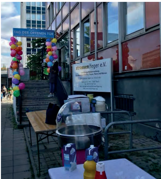
15.9.18: Tag der offenen Tür