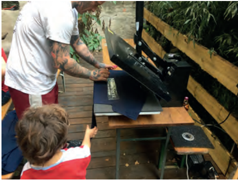
08.09. 2018 Teambuilding Aktion Ehrenamtliche T-Shirt Druck